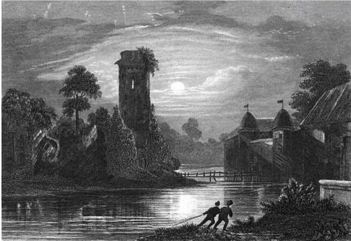
Die Ruine Schönforst um 1836